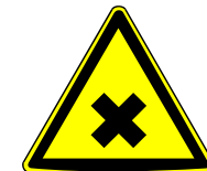
Abb.: Warnhinweis an Zugängen und Warnzeichen W18